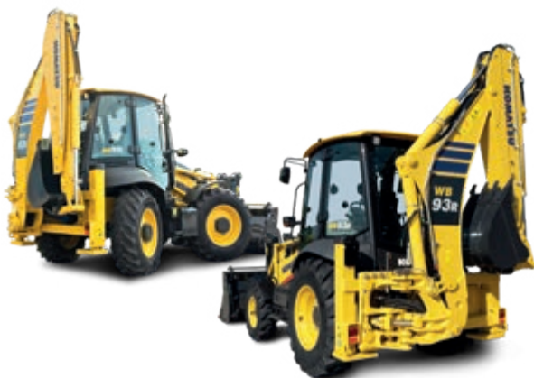
Új merevvázas és négykerék kormányzású kotró-rakodó modellek