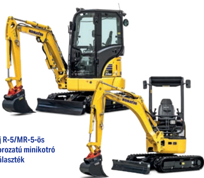
Új R-5/MR-5-ös sorozatú minikotró választék