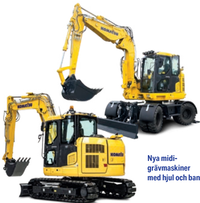
Nya midi- grävmaskiner med hjul och band