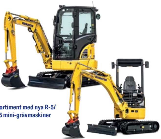
Ett sortiment med nya R-5/ MR-5 mini-grävmaskiner