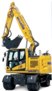
Graafmachines op banden