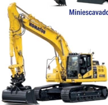
Modelos de escavadoras hidráulicas e tratores de rastos com sistema de controlo inteligente 2.0