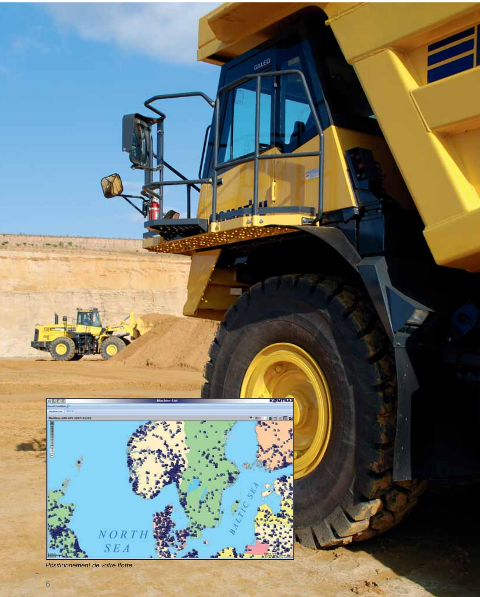
Positionnement de votre flotte