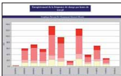
Informations sur le chargement