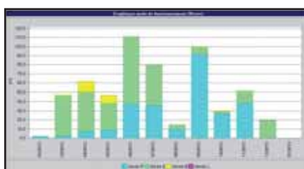
Données du mode d'activité