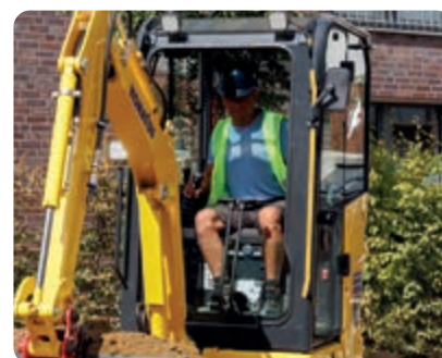
Le ampie superfici vetrate offrono un'eccellente visuale a 360 gradi sull'area di lavoro