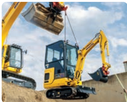
Sollevamento rapido e semplice mediante funi, senza bisogno di ulteriori attrezzi