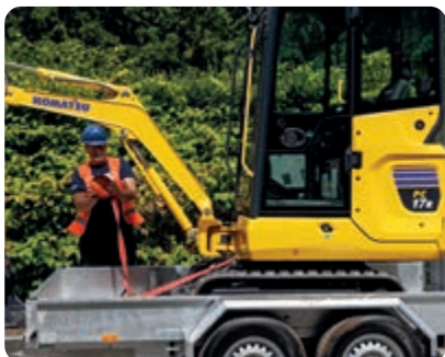
Punti di ancoraggio sulla torretta aiutano a fissare rapidamente la macchina per il trasporto