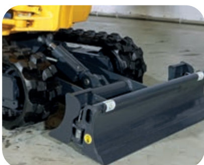
Lama pieghevole per l'adattamento alla carreggiata variabile del sottocarro