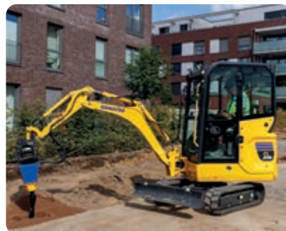
Controllo perfetto anche nelle operazioni combinate