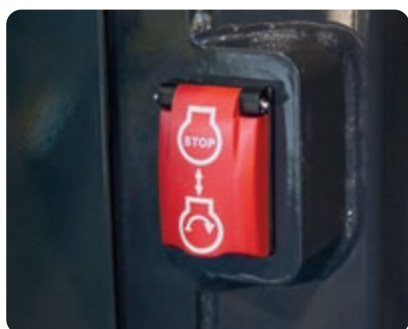
Interruttore secondario di arresto motore