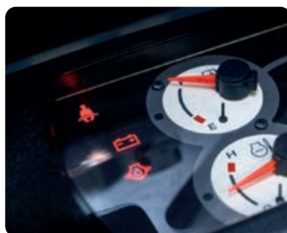
Indicatore cintura di sicurezza sedile sul cruscotto