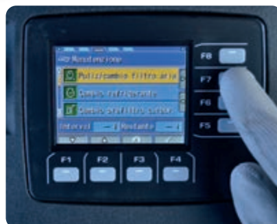
Schermata della manutenzione di base sul monitor a colori da 3,5"