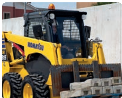
Ottima visuale sulle attrezzature di lavoro e sul cantiere