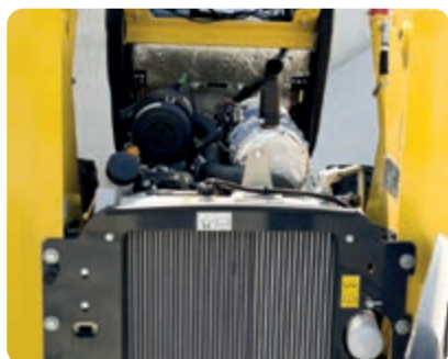
Facile accesso ai punti di manutenzione giornaliera

La manutenzione ed i controlli ordinari possono essere effettuati semplicemente aprendo il cofano motore che permette all'operatore anche l'accesso e la pulizia ai radiatori inclinati. Per la manutenzione straordinaria, la cabina ribaltabile offre completo accesso alla trasmissione e ai principali componenti del sistema idraulico. Speciali boccole autolubrificanti consentono un intervallo di ingrassaggio di tutti i perni fino a 250 ore.