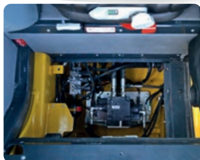
Grazie al cofano all'interno della cabina, la manutenzione straordinaria della valvola principale può essere eseguita rapidamente senza ribaltare la cabina