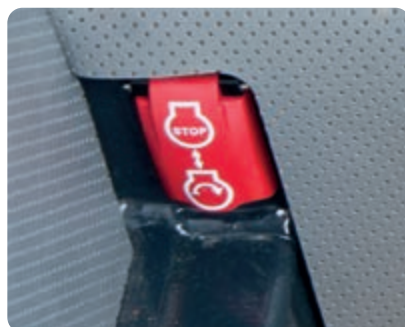
Interruttore secondario di arresto motore